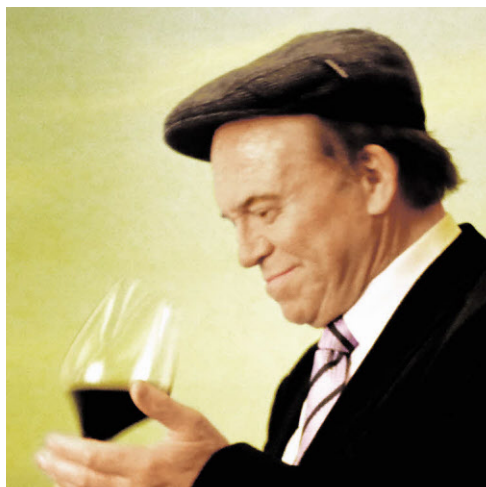
Heinz Winkler: „Ich liebe Wein.“